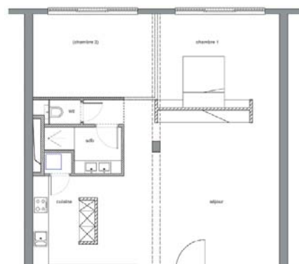
Typeappartement met 2 kamers